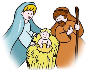
Immagine da inserire all'interno del cuore.