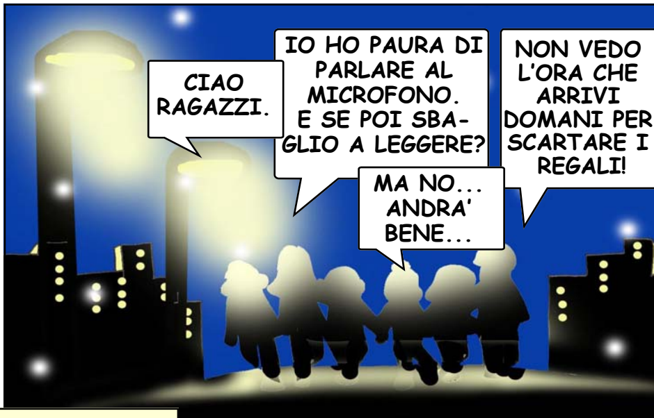
I ragazzi arrivano